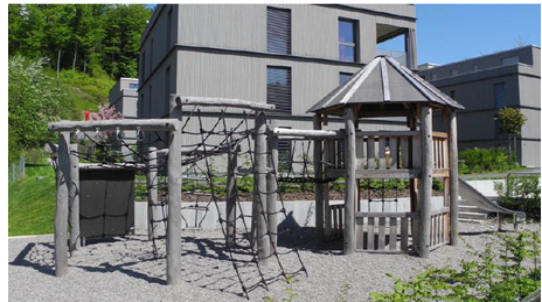
Färg-obehandlad Robinia efter ett år