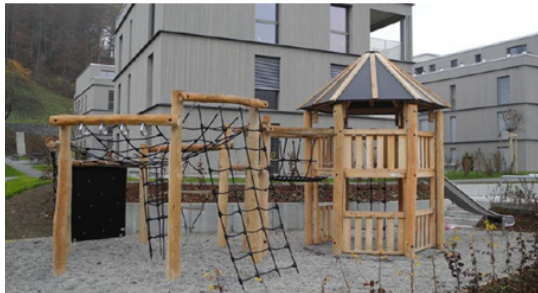
Färg-obehandlad Robinia nyligen installerad

De två bilderna nedan visar en färg-obehandlad robinias naturliga färgskiftning.