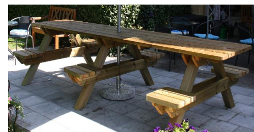
Ett nyinoljat bord från våra kunder

För att behålla den fräscha utseendet kan man bstryka med träolja. Det hjälper även virket att motstå vissa formförändringar, typ sprickbildningar.