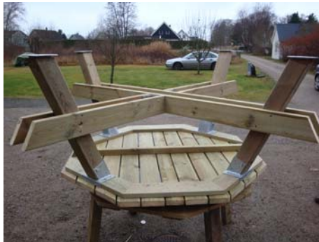
Bordet med samtliga ben och bärlinor fastmonterade.