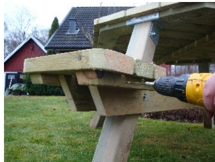
Fastsätt vardera sits med totalt fyra st. skruv, två vardera sida.

Du har nu monterat färdigt ditt Tillgängliga Oktagonbord!