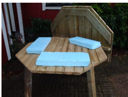
Bra arbetshöjd samt skyddade underlag.

Vända på bordsskivan och se till så att du har en bra arbetshöjd samt skyddar ovansidan med något mjukt underlag.