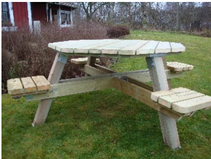
Placera ut de fyra sitsarna.

Vänd på bordet och placera ut de fyra sitsarna. Fastsätt därefter de fyra sitsarna med trallskruv, 4,8x80. Två skruv vardera sida om varje sits som du fäster i sitsens knaper in i benet.