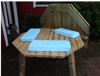
Bra arbetshöjd samt skyddade underlag.

Vända på bordsskivan och se till så att du har en bra arbetshöjd samt skyddar ovansidan med något mjukt underlag.