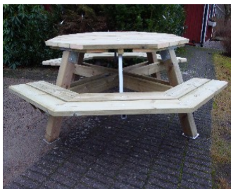
Placera ut de två sitsarna.

Placera ut de båda sittbänkarna. Börja med att fästa sittbänkarna med 2 st. trallskruv 4,8x75 mm i vardera bärlina. Borra därefter upp för hålen i Z-profilen (2 förborrade hål i Z-profilen), 2 st. vagnsbultar 6,0x80 i vardera sits. Lås med mutter och bricka.