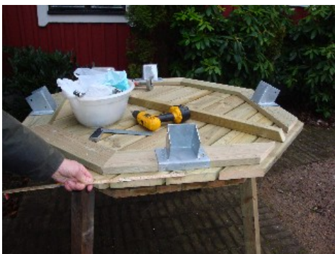
Centrera hylsan så att den hamnar i mitten av sidan. Notera i bilden också vilka sidor du ska montera hylsor på.

Centrera på de sidor där hylsorna/benen skall monteras. Benen sitter redan monterade i hylsorna vid leverans till skillnad på vad den ena bilden nedan visar. Observera vilka sidor du skall montera hylsorna på. Detta framgår av bilden nedan. Därefter skruvar du fast hylsorna i bordet med hjälp av skruv. Totalt 7 st. ankarskruvar (3+2+2), i de förborrade hålen i hylsorna.