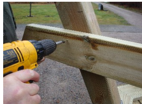
Fäst bärlinan i benet med skruv, två st. i respektive bärlina och ben.