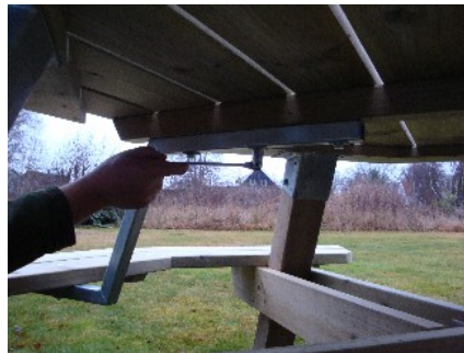
Fastsätt Z-profilen med 3 st. vagnsbult samt bricka och mutter

Vänd på bordsskivan. Z-profilens ena sida har 3 st. färdigborrade hål vilket även bordsskivan har. Du monterar därmed Z-profilen med 3 st. vagnsbultar 8,0x130 i bordsskivan och låser med bricka och mutter.