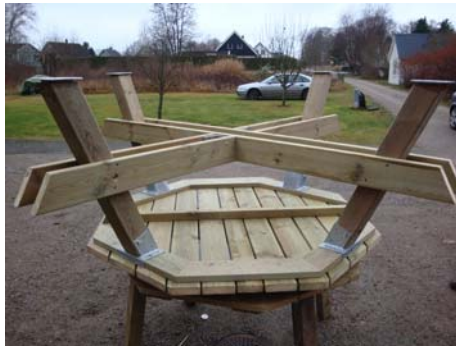
Bordet med samtliga ben och bärlinor fastmonterade.