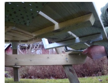
Montera sitsen i Z-profilen med 2 st. vagnsbult 6,0x80, bricka och mutter.