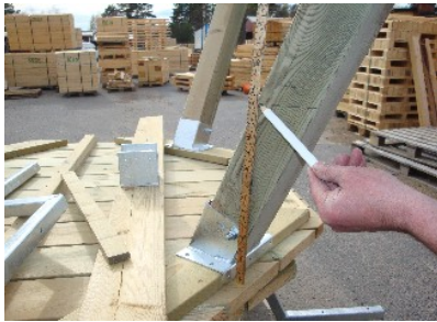
Saknas märkningen så märk ut rätt höjd (33,5 cm), från underkant på bordsskivan. (Barnmodell 28,5)

Börja med de två långa bärlinorna (E). På respektive ben skall det finnas en märkning som visar på vilken höjd du skall montera bärlinan på. Saknas märkningen på benet så gäller höjden ca 33,5 cm mätt från bordsskivans underkant, se bild nedan. OBS – För alla bärlinorna så skall det skjuta ut 28 cm från benet. När du märkt ut rätt höjd samt har rätt längd mellan ben och ytterkant på bärlinan så fixerar du bärlinan med skruvtving.