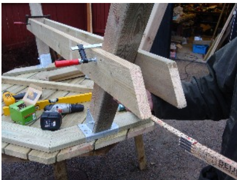
Fixera med skruvtving och kontroller höjdmåtten samt avståndsmåtten på vardera sida. Fäst därefter med skruv.

Därefter fixerar och fäster bärlinorna i benet med trallskruv (2 st. i respektive bärlina och ben, totalt 16 st. 4,8x90 mm för samtliga bärlinor).