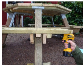
Montera med 2 st. trallskruv i vardera knaper och bärlina.