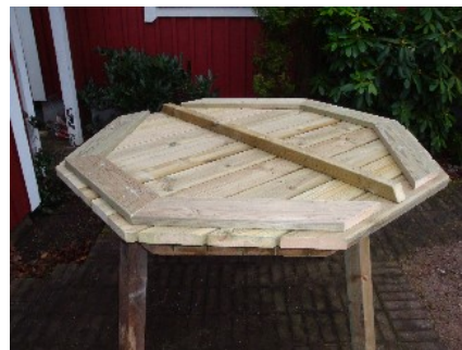
Bordsskivan ligger upp och ner, färdig för att påbörja monteringen.

Centrera på de sidor där hylsorna/benen skall monteras. Benen sitter redan monterade i hylsorna vid leverans till skillnad på vad den ena bilden nedan visar. Observera vilka sidor du skall montera hylsorna på. Detta framgår av bilden nedan. Därefter skruvar du fast hylsorna i bordet med hjälp av skruv. Totalt 7 st. ankarskruvar (3+2+2), i de förborrade hålen i hylsorna.