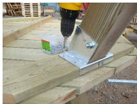
Montera därefter hylsan med 7 st. ankarskruvar.