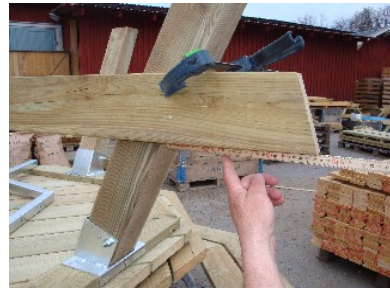
Kontroller att du har rätt avstånd mellan benet och bärlinans slut skall vara 28 cm på samtliga sidor.

Därefter fixerar och fäster bärlinorna i benet med trallskruv (2 st. i respektive bärlina och ben, totalt 16 st. 4,8x90 mm för samtliga bärlinor).