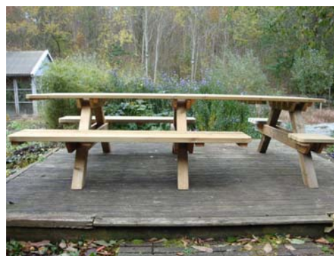
Bilden visar sittbänkarnas placering utan ryggstöden som du dock skall ha monterat i föregående moment.