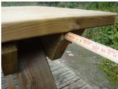
Centrering av bordet. Ca 14-16 mm på vardera sida.

Montera därefter benparet i mitten, benpar 2. Placera benpar 2 så att bordsskivans knaper kommer till höger om benparet. Centrera även här med samma antal millimeter på vardera sida om bordet, ca 14-16 mm. Fäst därefter bordsskivan med 3 st. trallskruv.