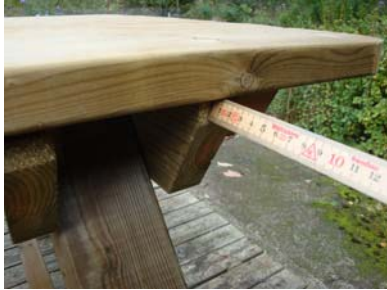
Centrering av bordet. Ca 14-16 mm på vardera sida.

Börja med benpar 1 för fastsättning av bordets högra sida (mindre överhäng). Innan du fäster med skruv ska du centrera bordsskivan. Fäst därefter bordsskivan i benpar 1 med 3 st. trallskruv. Notera att bordsskivans högra regel (knaper) skall hamna på utsidan av benparet.