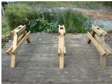
Placera ut benparen.

Justera bordsskivans knapprar (små reglar på bordsskivans underkant) så att de ligger tätt mot respektive benpar. Här skall du sedan fästa med skruv fast innan du gör det ska du centrera bordsskivan.