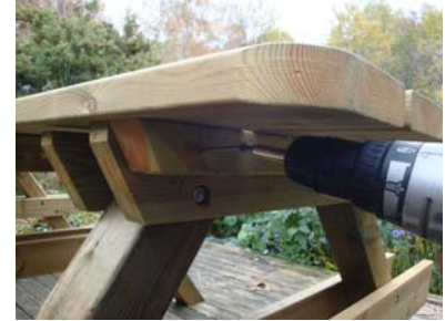
Montera med 3 st. trallskruv i bordets knaper och benpar.

Montera därefter benparet i mitten, benpar 2. Placera benpar 2 så att bordsskivans knaper kommer till höger om benparet. Centrera även här med samma antal millimeter på vardera sida om bordet, ca 14-16 mm. Fäst därefter bordsskivan med 3 st. trallskruv.