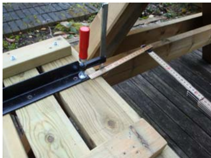
Kontroller avstånd 3 cm.