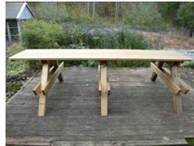
Placera bordsskivan uppe på benparen.

På bordsskivans högerkant har du ett mindre överhäng och på bordsskivans vänsterkant har du ett större överhäng på 59 cm.