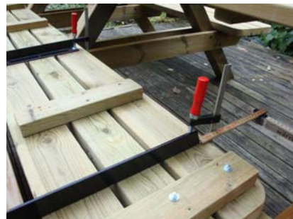
Kontrollera att du har samma avstånd på båda sidor.