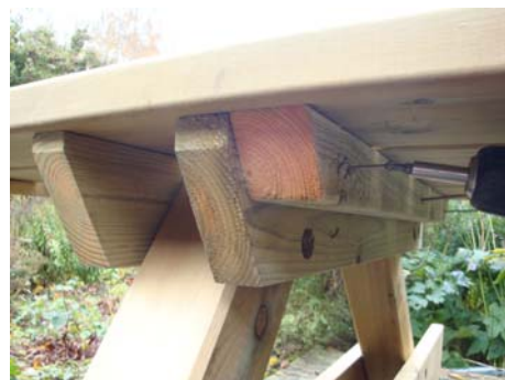
Fäst därefter med 3 st. skruv.