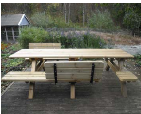
Placera ut de båda sittbänkarna med ryggstöden som du nu har monterat i föregående moment.

Den längre sittbrädan placerar du på sidan mot dig så att du får sittbrädans kant i linje med bordets vänstra ytterkant, se bild nedan.