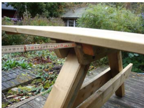
Centreringar. 14-16 mm på vardera sida av bordet.

Slutligen monterar du benpar 3 på bordets vänstra sida. På denna sida har bordet ett överhäng på 59 cm. Bordsskivans knaper där du sedan fäster med trallskruv skall ligga till höger om benpar 3. Centrera först bordsskivan på liknande sätt som innan du slutligen monterar bordsskivan i benparet med 3 st. trallskruv.