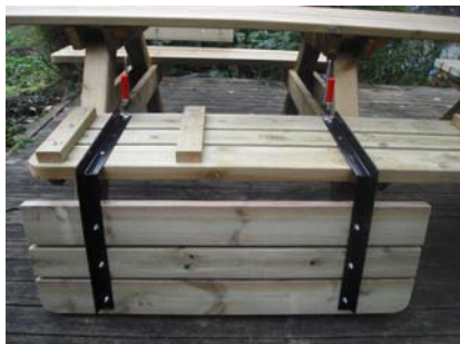
Vänd sittbrädan upp och ner vid montering av ryggstöden.

Vänd sittbrädan upp och ner vid montering av ryggstödet och använd exempelvis skruvtving för att fixera ryggstödet underdel på rätt plats. Du justerar ryggstödet placering genom att avståndet mellan ryggstödet början och sittbänkens innerkant (mot bordet) skall vara 3 cm.