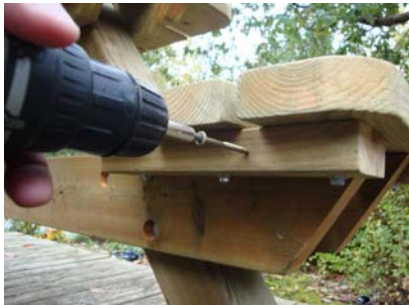
Fäst varje sits med 3 st. trallskruv vardera sida.