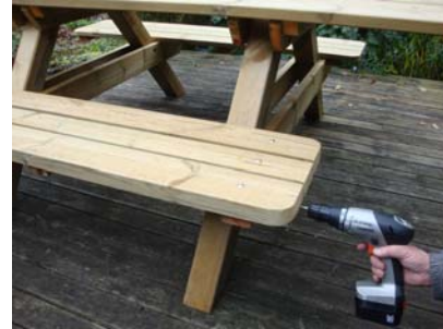
Bilden visar en sittbänk utan ryggstöd som du ju har monterat men du fäster med skruv enligt samma princip.