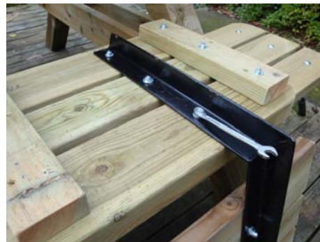
Fastsätt slutligen ryggstödet med bult, låsbricka och mutter.