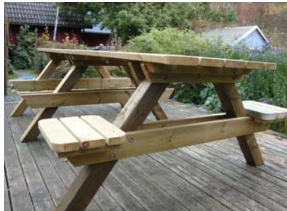
Placera ut de mindre sitsarna.

Placera ut de två sitsarna på benpar 1. Fäst därefter varje sits med 3 st. trallskruv vardera sida om benparets bärlina.