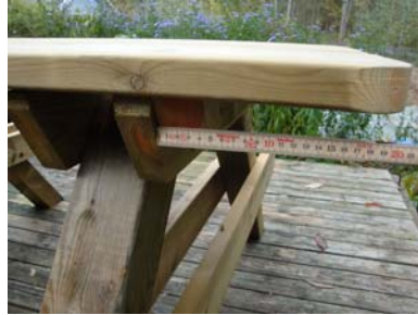
Kontroller mått 19 cm.