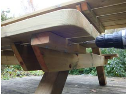
Fäst därefter med 3 st. skruv i vardera knaper och benpar.

Montera därefter sittbrädorna med trallskruv, totalt 6 st. för vardera sittbräda vilket innebär att du sätter 3 st. skruv i respektive benpar.