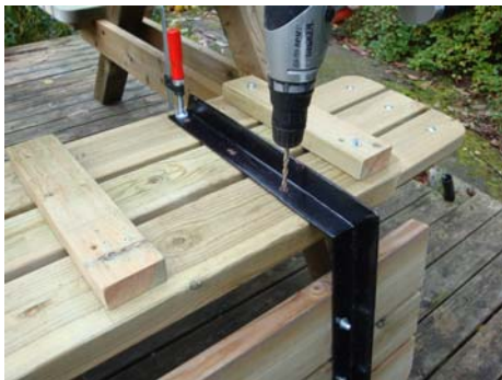
Borra i ryggstödet förborrade hål.

Fastsätt slutligen ryggstödet i sittbänken med 6 mm vagnsbult.