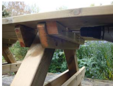
Montera med 3 st. trallskruv i bordets knaper och benpar.