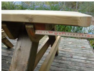
Kontrollerer mått, 19 cm.