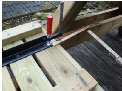
Kontroller avstånd 3 cm.