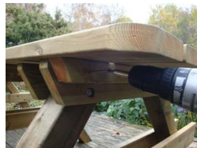
Montera med 3 st. trallskruv i bordets knaper och benpar.

Montera därefter benparet i mitten, benpar 2. Placera benpar 2 så att bordsskivans knaper kommer till höger om benparet. Centrera även här med samma antal millimeter på vardera sida om bordet, ca 14-16 mm. Fäst därefter bordsskivan med 3 st. trallskruv.