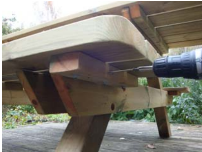
Fäst därefter med 3 st. skruv i vardera knaper och benpar.

Montera därefter sittbrädorna med trallskruv, totalt 6 st. för vardera sittbräda vilket innebär att du sätter 3 st. skruv i respektive benpar.