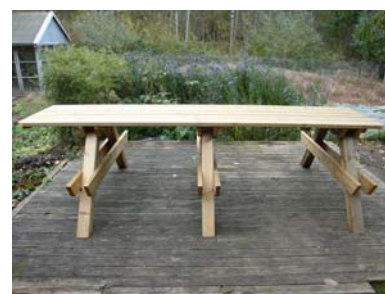
Placera bordsskivan uppe på benparen.

På bordsskivans högerkant har du ett mindre överhäng och på bordsskivans vänsterkant har du ett större överhäng på 59 cm.