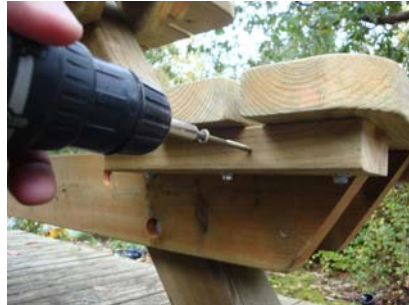
Fäst varje sits med 3 st. trallskruv vardera sida.