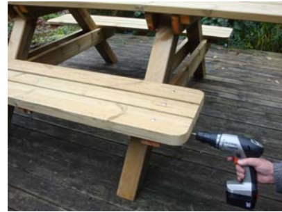
Bilden visar en sittbänk utan ryggstöd som du ju har monterat men du fäster med skruv enligt samma princip.