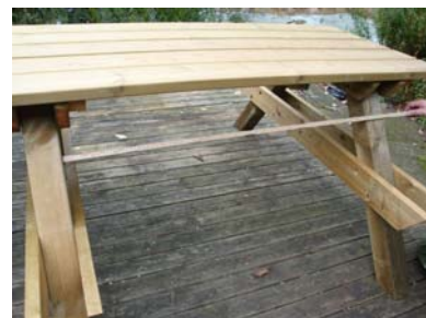
Kontrollera och kolla avståndsmått ca 110 cm.

Slutligen monterar du benpar 3 på bordets vänstra sida. På denna sida har bordet ett överhäng på 59 cm. Bordsskivans knaper där du sedan fäster med trallskruv skall ligga till höger om benpar 3. Centrera först bordsskivan på liknande sätt som innan du slutligen monterar bordsskivan i benparet med 3 st. trallskruv.