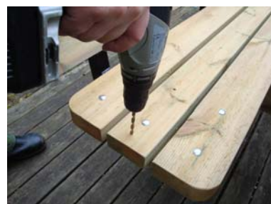
Borra därefter i märkning för plats för bult.