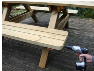
Bilden visar en sittbänk utan ryggstöd som du ju har monterat men du fäster med skruv enligt samma princip.