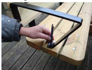
Märk med penna i de förborrade hålen.