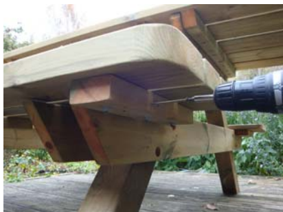
Fäst därefter med 3 st. skruv i vardera knaper och benpar.

Montera därefter sittbrädorna med trallskruv, totalt 6 st. för vardera sittbräda vilket innebär att du sätter 3 st. skruv i respektive benpar.