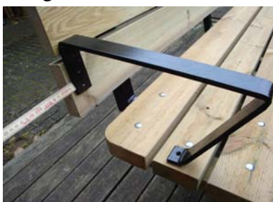
Justera så att du får samma avstånd uppe och nere, 1 cm.

Justera armstödet så att du har 1 cm mellan sittbänkens ytterkant och ryggstödet. Märk med penna i de förborrade hålen på armstödet. Borra därefter i märkning med 6,5 mm borrar. Slutligen fastsätter du armstödet med vagnsbultar, 3 st. i vardera armstöd.